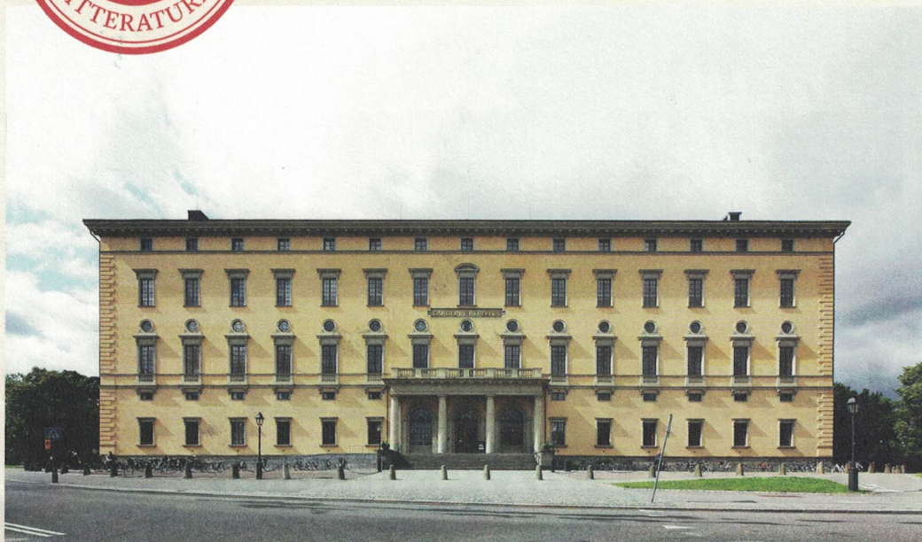
Handlingen och spaningarna efter den skyldige rör sig till stor del i klassiska akademiska kvarter i centrala Uppsala, bland annat på Carolina Rediviva.